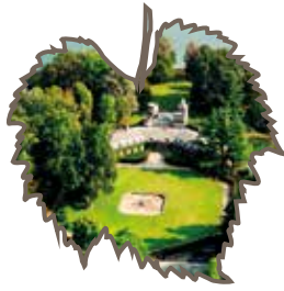
Trekking nel Parco